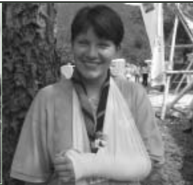
Prva zlomljena roka